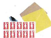
Nécessaire de courrier

Emballer les aliments dans des boîtes en plastique transparent ou des sachets plastiques (type sachets de congélation) fermés avec des élastiques ou des liens sans métal