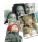
Photos, dessins d'enfants