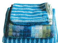
Linge de toilette